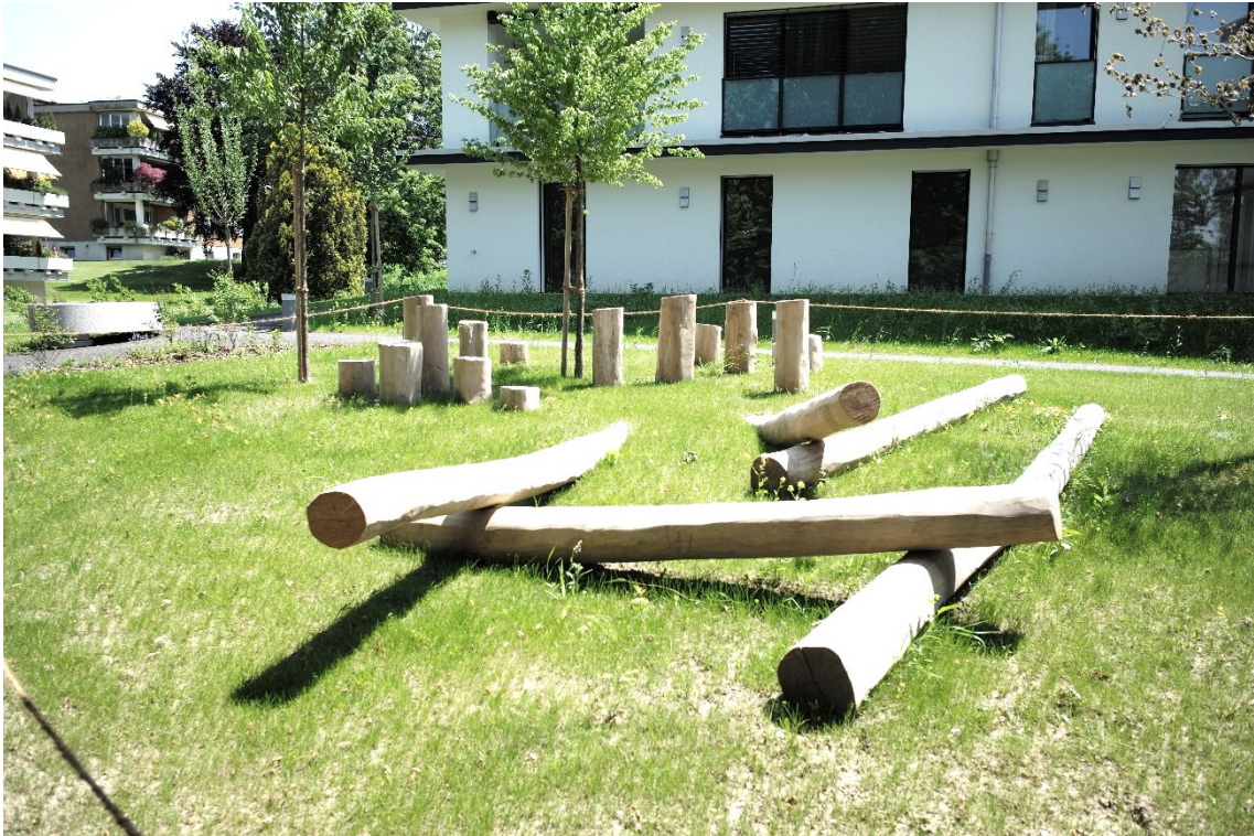
Abb. 10: Einfache Balancier-, Kletter- und Sitzelemente aus rohen Robinienstämmen