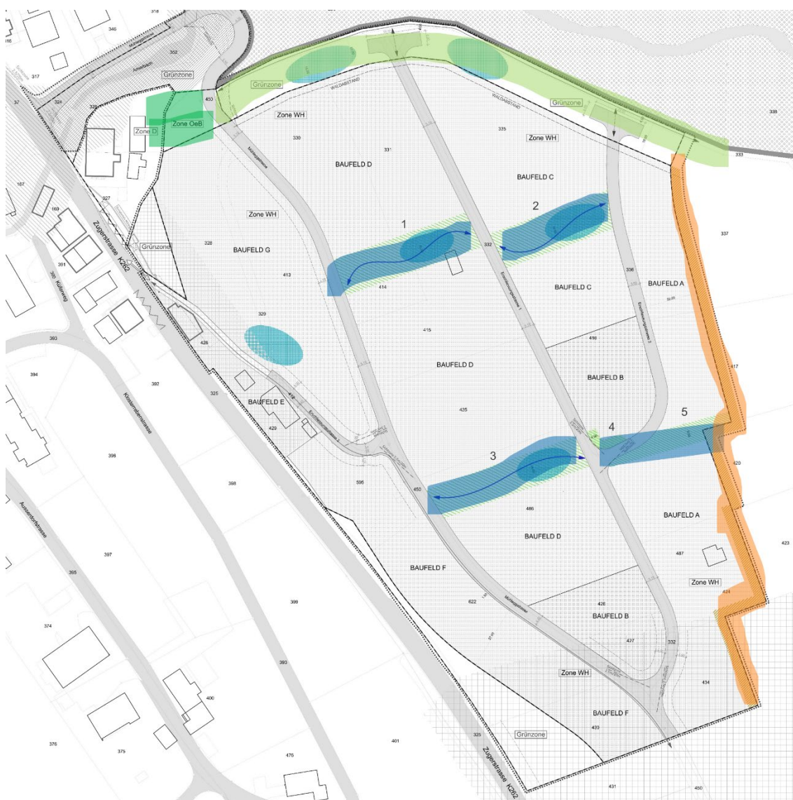
Abb. 3: Räumliche Gliederung

Die gemäss diesen Argumenten erstellte Gliederung präsentiert sich wie folgt: