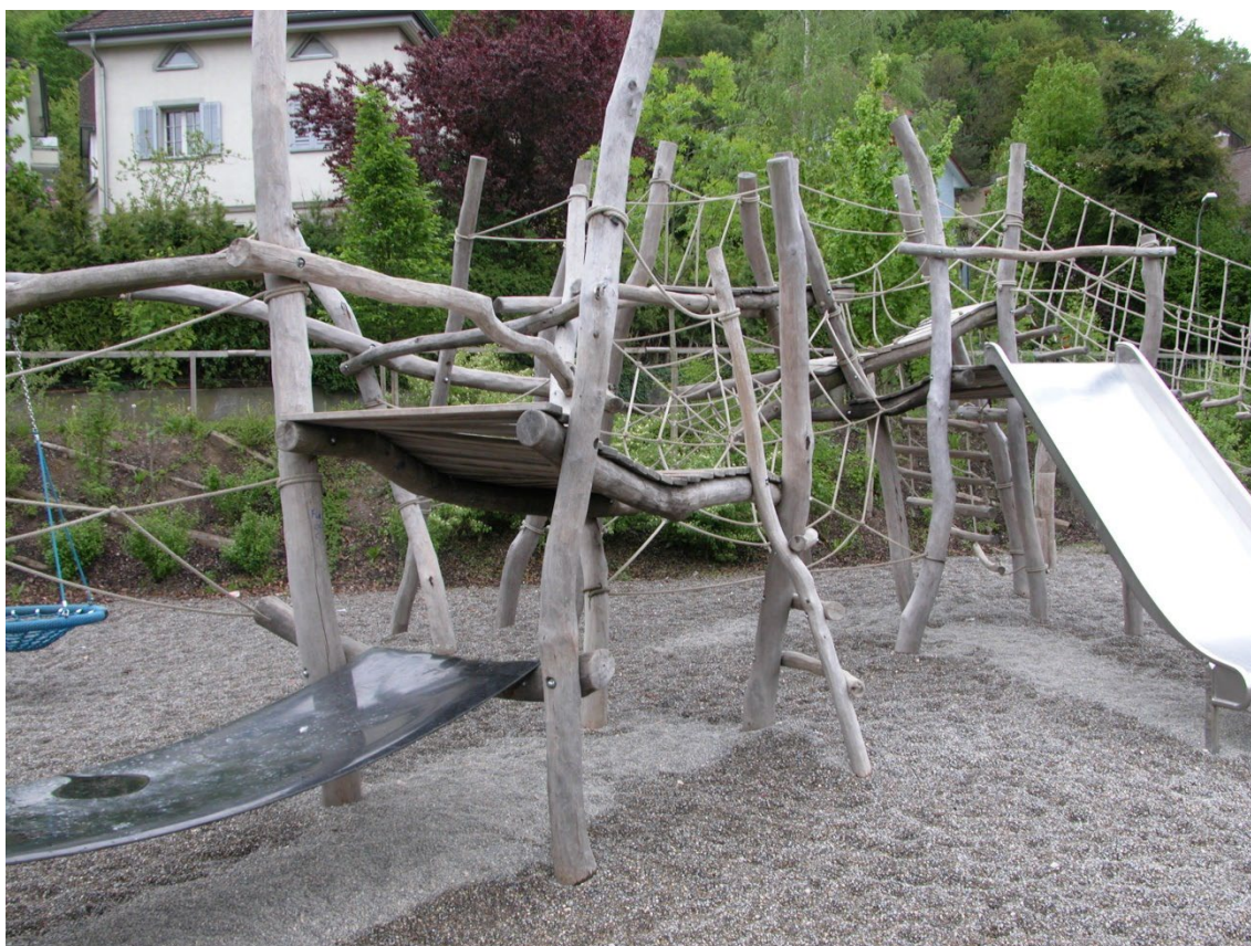
Abb. 7: Beispiel einer attraktiven, vielfältigen Spielanlage. Details zu den Spielgeräten: siehe Plan.

Die Details sind im Plan ausgewiesen. Die Fläche liegt in der Zone OeBA, daher sind aufwändigere Anlagen (mit Fundationen usw.) zulässig.