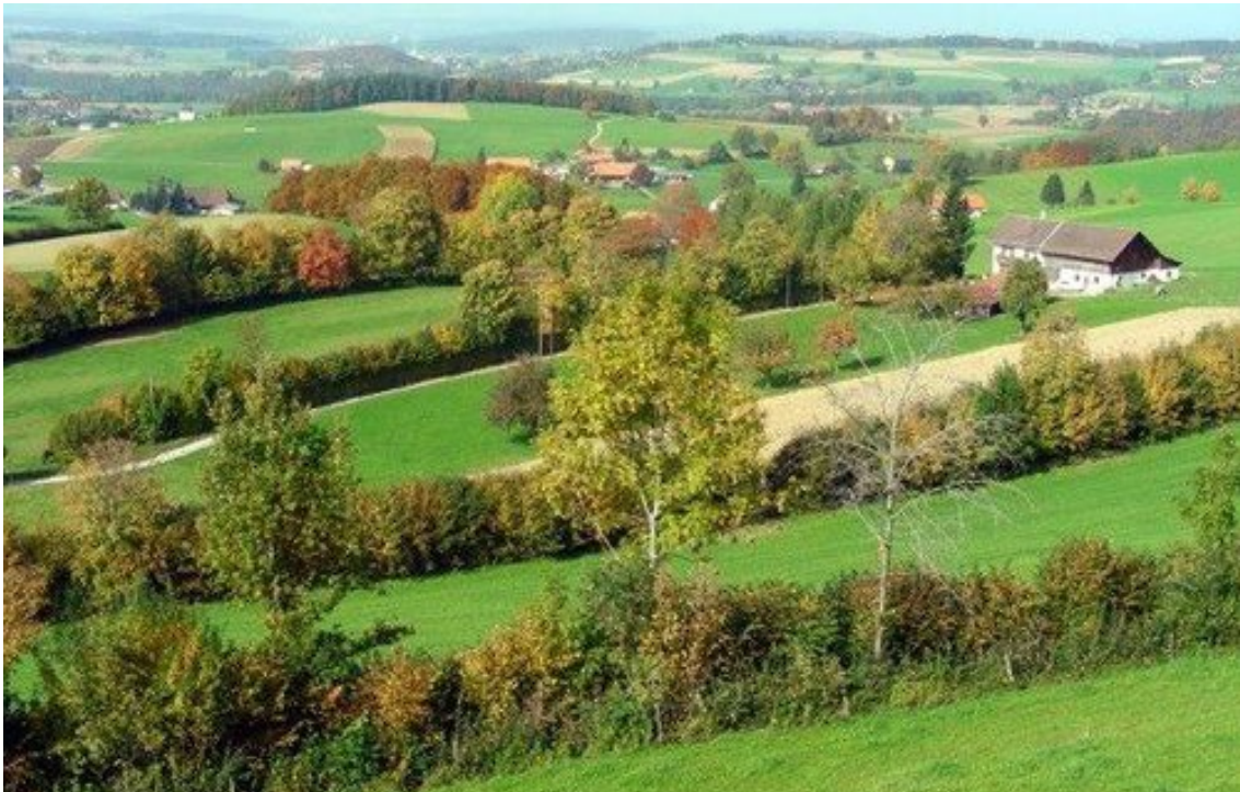
Abb. 13: Heckenbänder, mit Bäumen durchsetzt