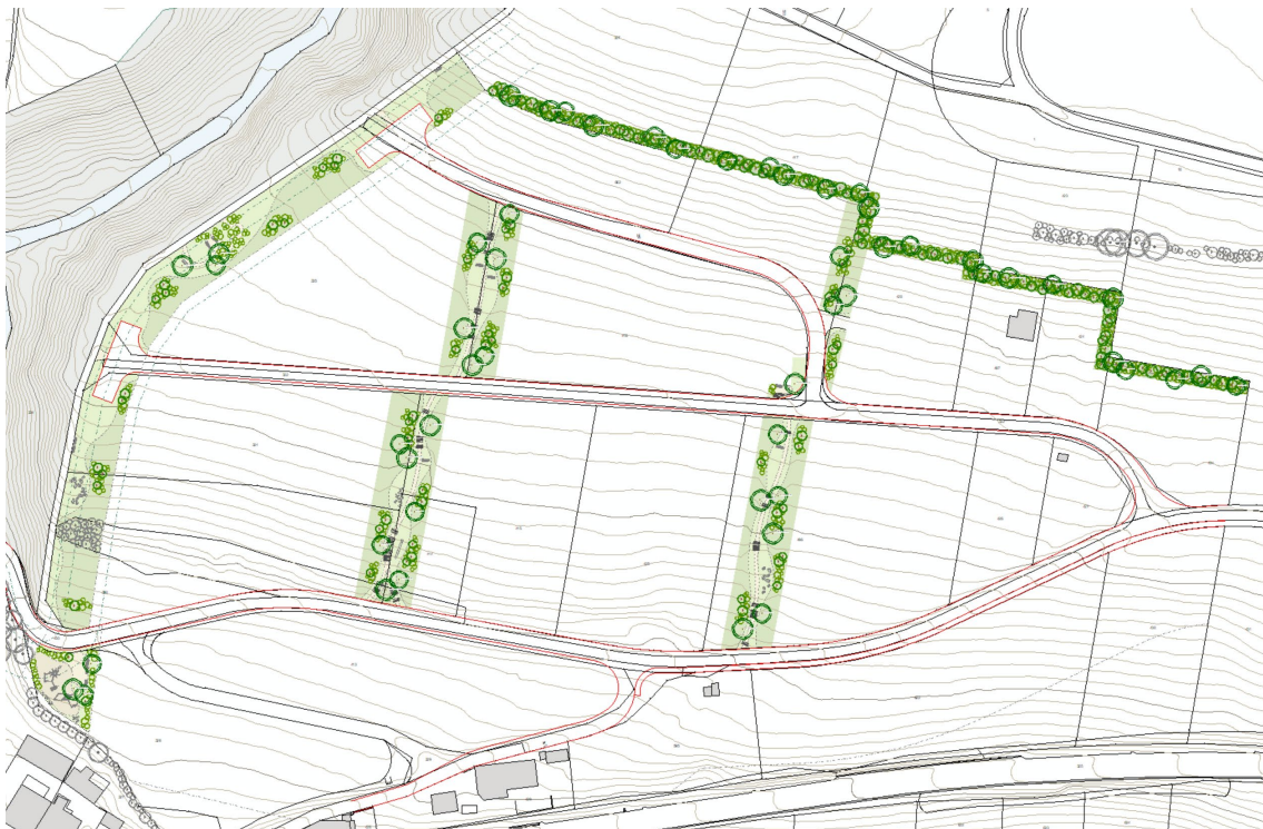
Abb. 15: Gesamtplan Projektskizze Freiraum und Ökologie Mühlegg (Original im Mst. 1 : 250)

Diese decken die gemäss § 38 BNO erforderlichen Spielflächen ab. Sie haben rein privaten Charakter und werden folglich nicht im Grundbuch angemerkt, sondern mit den jeweils angrenzenden Baugesuchen behandelt und gestützt auf den Gestaltungsplan verfügt.