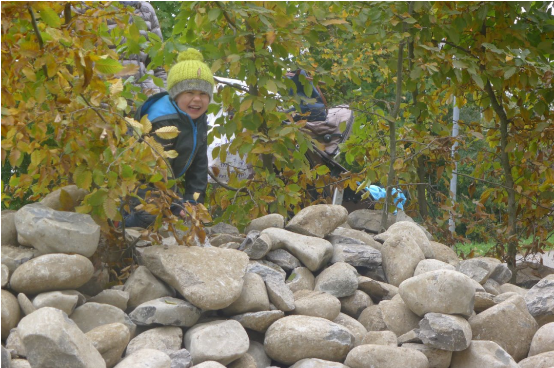
Abb. 5: Referenzbild zum Spielen im Waldrandbereich. Ganz einfache, naturnahe Installationen wie beispielsweise ein Steinhaufen regen die Fantasie an und animieren zu freiem Spielen. Details zum «Klettergarten»: Siehe Plan.