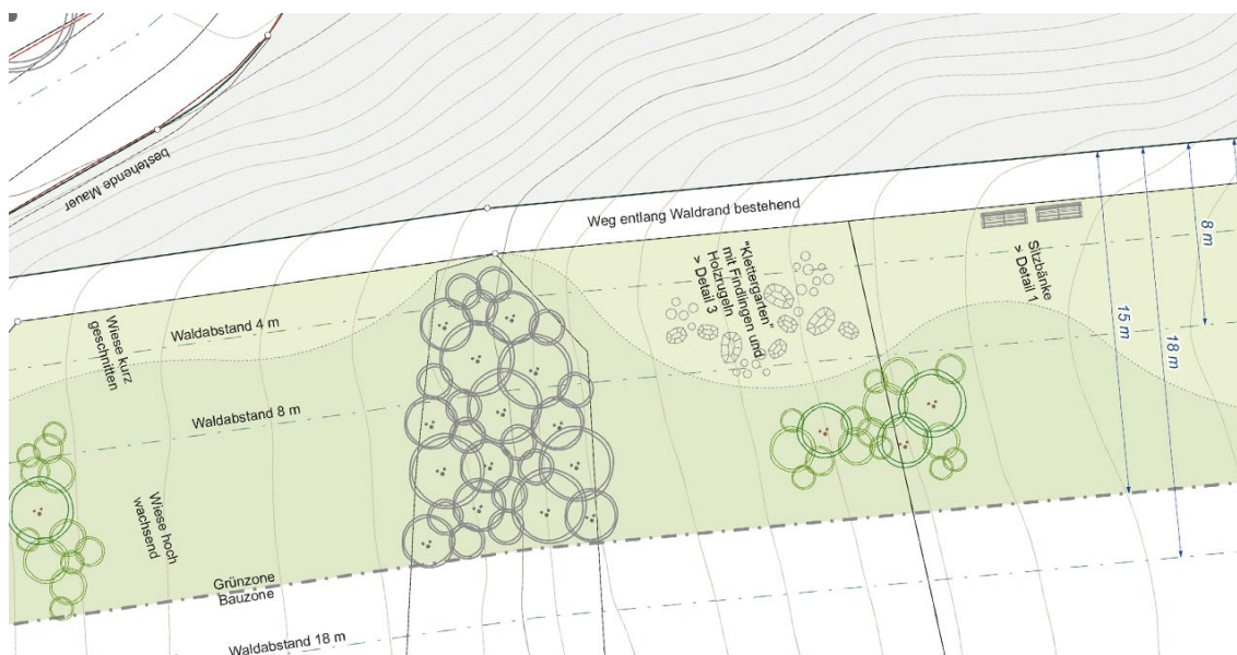
Abb. 4: Ausschnitt aus dem Waldrandbereich

Dieser Bereich umfasst zwei gemeinschaftlich nutzbare Spielflächen.