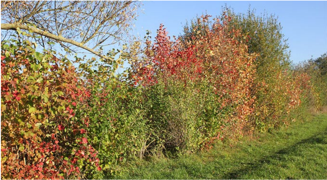
Abb. 14: Herbstaspekt einer artenreichen Hecke