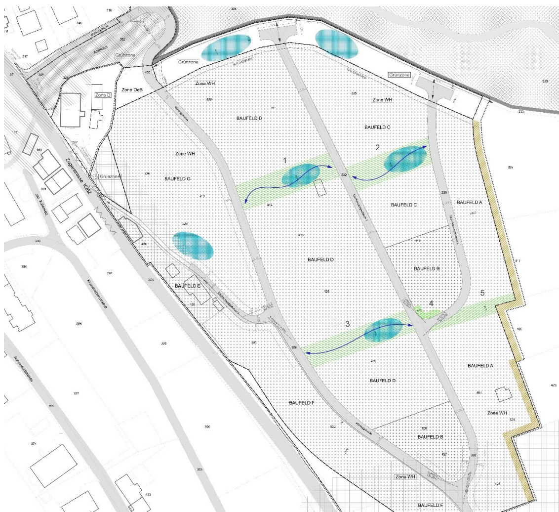
Abb. 1: Vernetzungskorridore (grün), Bereich Hochhecke (braun), gemeinschaftlich nutzbare Spielflächen (blau)

Im Situationsplan sind die Flächen wie folgt verortet: