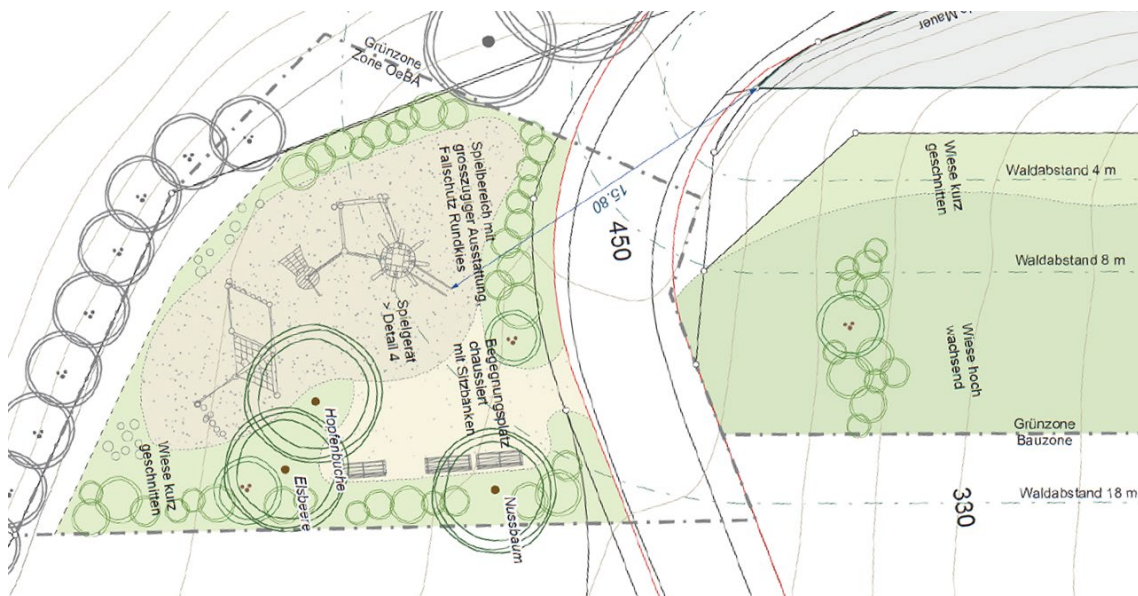
Abb. 6: Planausschnitt zum grossen öffentlichen Spielbereich