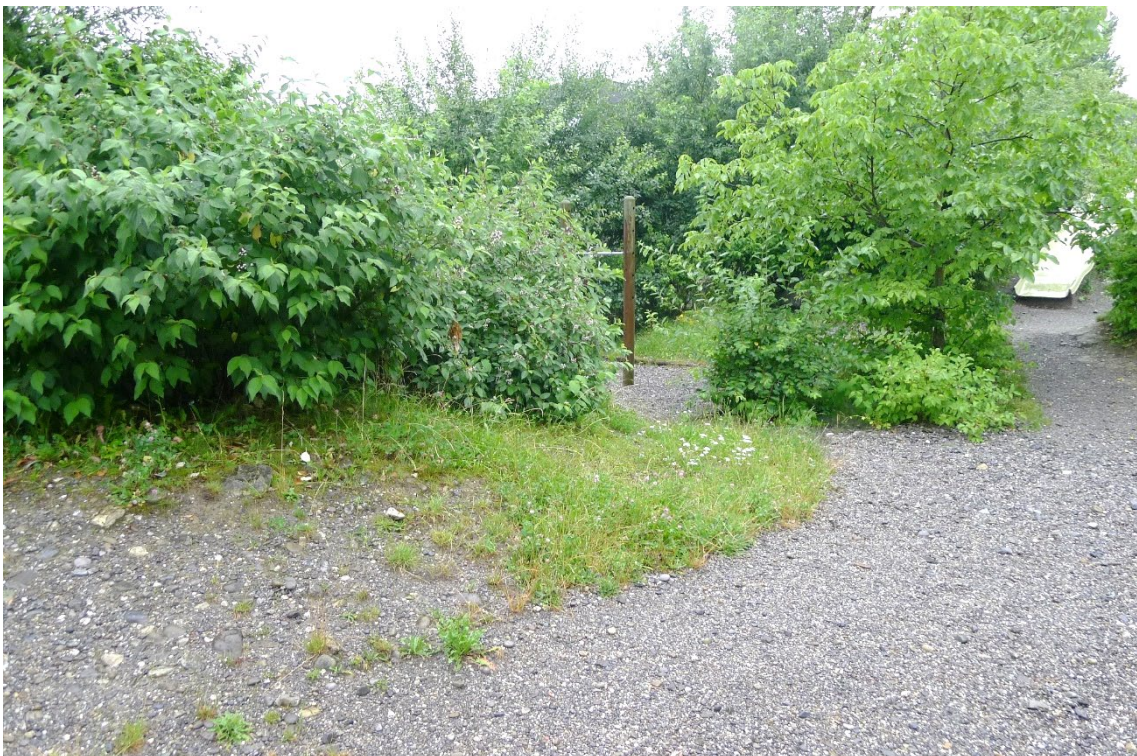
Abb. 11: Gebüschgruppen gliedern die grünen Korridore, sind ökologisch wertvoll und regen gleichsam zum Entdecken der Natur ein.