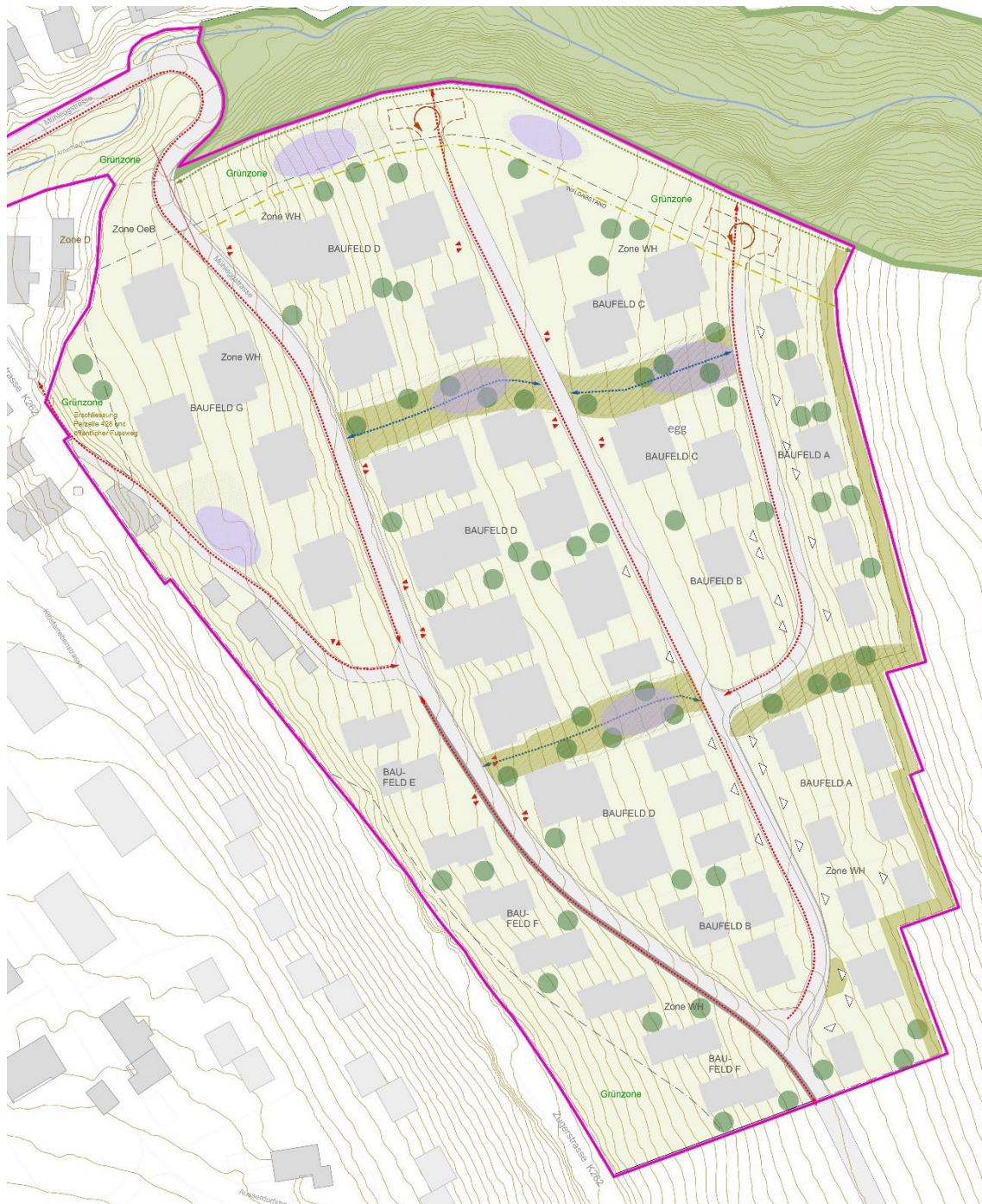
Abb. 2: Freiraumkonzept. Die Verwandtschaft mit den Inhalten des Gestaltungsplans ist unschwer zu erkennen.

Als Basis für den Gestaltungsplan dienten ein Freiraum- und ein Vernetzungskonzept. Deren Inhalte sind vollständig in den Gestaltungsplan eingeflossen, weswegen sich eine Darlegung der entsprechenden Inhalte im vorliegenden Bericht erübrigt.